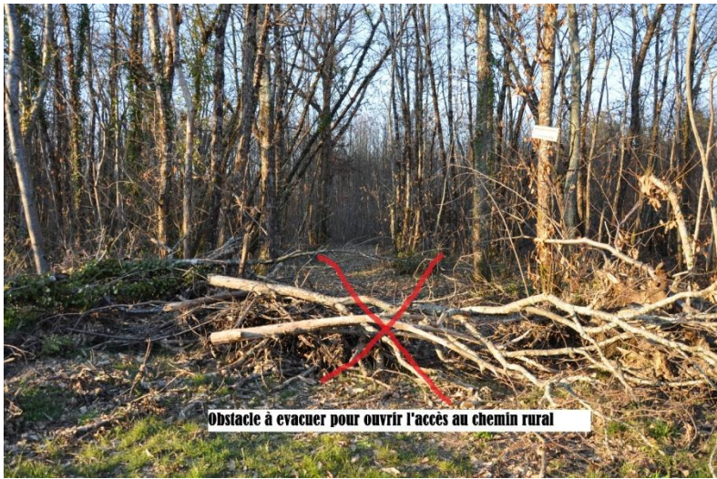
Obstacle à évacuer pour ouvrir l'accès au chemin rural